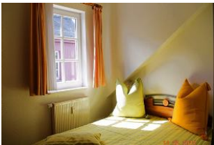
Blick in den 2. Schlafraum.