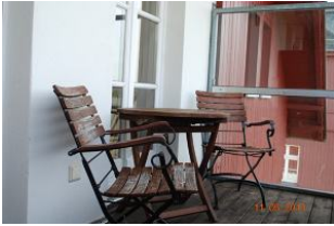
Blick auf den Balkon.