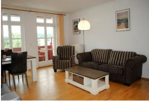
Blick auf die Sitzzecke.