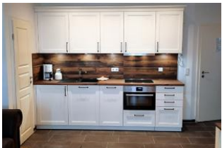
Blick auf die Küchenzeile.