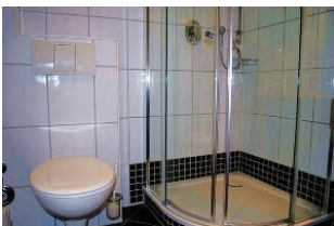
Blick in das Duschbad.