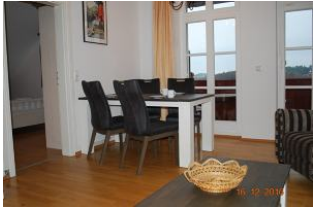
Blick auf den Essplatz, den dahinter liegenden Balkon und das 1.Schlafzimmer.