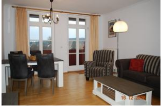
Blick in den Wohnbereich.