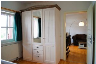
Blick vom 1.Schlafraum zum Wohnraum.