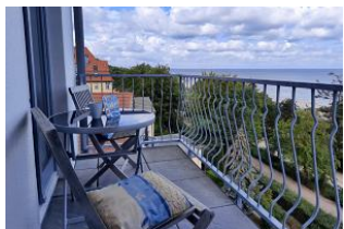
Blick auf den Balkon.