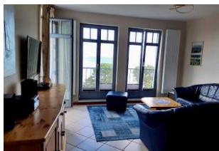
Blick in den Wohnraum.