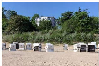
Blick vom Strand auf das Haus.

Der im Stil der Bäderarchitektur errichtete Neubau Haus am Kliff ist zusammen mit der historischen Villa Schering direkt an der Steilküste zur Ostsee gelegen. Das großflächige Grundstück mit altem Baumbestand und der gemeinschaftliche Garten bieten jede Menge Platz zum Spielen. Das 58 m 2 große Appartement 07 befindet sich im 1.OG und verfügt über einen großen Wohnraum mit offener voll ausgestatteter Küchenzeile und Essplatz, einen Balkon mit unverbautem Blick auf die Ostsee, ein Duschbad und zwei Schlafräume (Doppelbett und zwei Einzelbetten). Es stehen kostenfreies WLAN, ein PKW-Stellplatz und ein Abstellraum für Fahrräder zur Verfügung. Gegen Gebühr können im Keller des Hauses Waschmaschine und Trockner genutzt werden. Haustiere sind auf Anfrage gestattet.