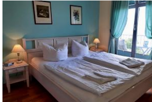
Blick in den 1. Schlafraum