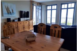
Blick vom Essplatz.