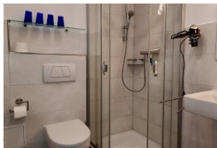
Blick in das moderne Duschbad.