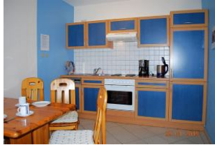
Blick auf die Küchenzeile.