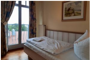
Blick in den 2. Schlafraum