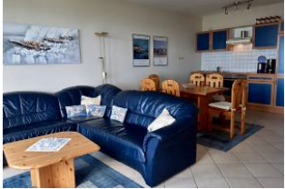
Blick vom Balkon in den Wohnraum.