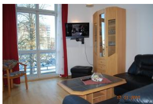
Blick zum Entertainment und zum Balkon.