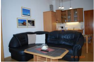
Blick auf die Sitzlandschaft und zur Küchenzeile.