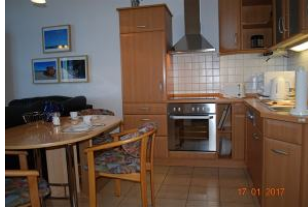
Blick auf den Essplatz und die Küchenzeile.