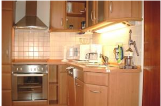
Blick in die Küche.