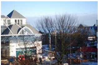
Blick vom Balkon in die Umgebung und Richtung Ostsee.