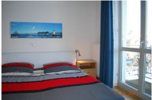
2. Blick in den Schlafrum und zum Balkon.