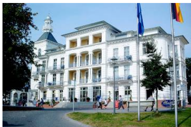
Blick vom Strandaufgang auf die prachtvolle Villa