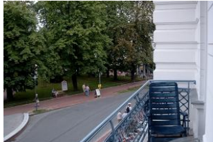
Blick auf den Balkon.