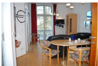
Blick in den Wohnbereich.

Wir sind Partner von UsedomRad. Leihen Sie sich bei uns im Büro ein Fahrrad aus und erkunden Sie unabhängig und flexibel die traumhafte und vielfältige Sonnensinsel Usedom.