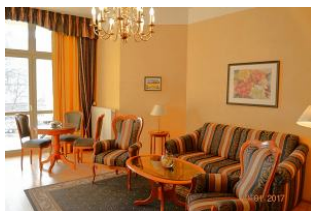
Blick auf die Sitzlandschaft.