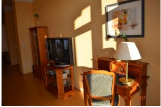
Blick von der Sitzlandschaft auf das Entertainment.