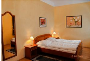
Das Schlafzimmer liegt abgewand der Seestr. und ist ruhig.