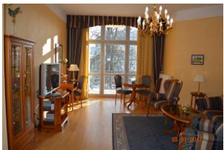
Blick in den Wohnraum.

In der deutschen Gründer- und Blütezeit Heringsdorfs 1882 erbaute der Geschäftsmann Erich Lindemann das damals zweifellos vornehmste Haus am Platz. Im Jahr 2002 komplett restauriert und mit einer hochwertigen Ausstattung versehen erstrahlt das ehemalige "Hotel Seeschloß" heute im neuen Glanz als exklusives Appartementhaus. Die zentrale und strandnahe Lage im Herzen von Heringsdorf ist ein idealer Ausgangspunkt für Ihren Urlaub. Das 65 m 2 große und gehoben eingerichtete Appartement 04 befindet sich im 1.OG des Hauses und verfügt über einen großzügigen Wohnraum mit kompletter Küchenzeile und Essplatz, einen Balkon mit Ostseeblick zur Seebrücke, einen Schlafraum (Doppelbett) und ein Vollbad mit Dusche und Badewanne. Es steht kostenfreies WLAN zur Verfügung. Haustiere sind nicht gestattet.