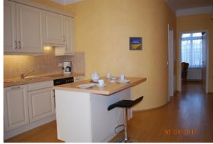
Blick auf die Küche mit Essplatz und in Richtung Schlafzimmer.