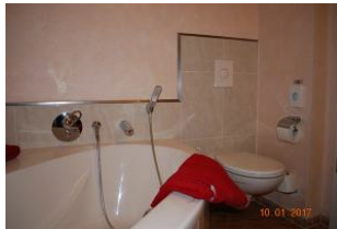
2. Blick in das Bad.