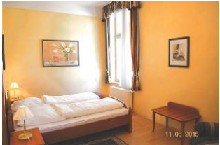
Blick in den Schlafrum.