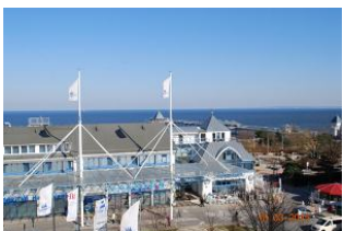
Blick vom Balkon in die Umgebung und zur Ostsee.