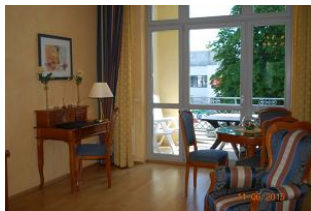
Blick auf den Balkon.