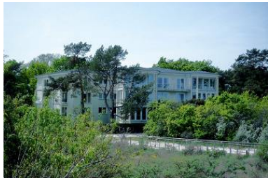
Blick von der Düne auf das Haus.