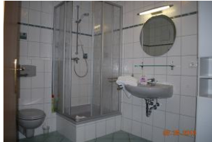
Blick in das Bad.