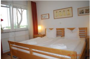
Blick in den Schlafraum.