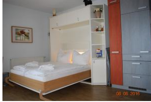
Blick auf das Schrankbett im Wohnraum.