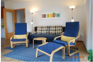
Blick auf die Sitzlandschaft.