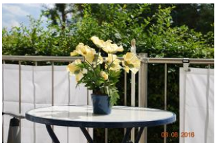
Blick auf den Balkon.