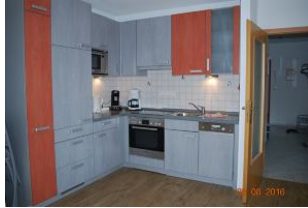
Blick auf die Küche.