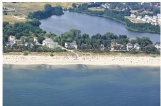
Blick aus der Luft.

Wir sind Partner von UsedomRad. Leihen Sie sich bei uns im Büro ein Fahrrad aus und erkunden Sie unabhängig die traumhafte und vielfältige Sonnensinsel Usedom. Als Kurkarteninhaber können Sie zudem die Busse der Usedomer Bäderbahn (UBB) kostenfrei nutzen.