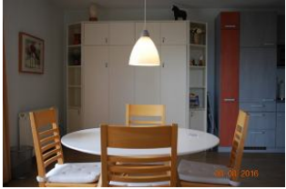
Blick auf den Essplatz und das Schrankbett.