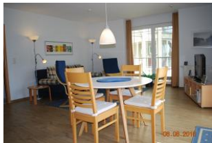
Blick von der Küchenzeile in den Wohnraum.