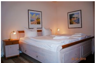
Blick in den Schlafraum.