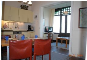
Blick vom Essplatz zur Loggia.