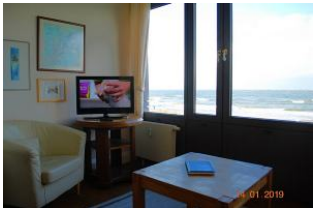
2. Blick in die Loggia.