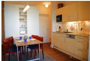
Blick zum Essplatz und zum Schlafraum.