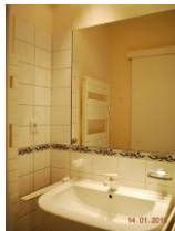
Blick in das Bad.