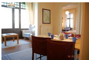
Blick von Eingang in den Wohnraum.

Zu Beginn des 20. Jahrhunderts wurden in den mondänen Badeorten an der Ostsee Villen im Schweizer oder Schwarzwälder Stil errichtet. Zu den schönsten Häusern dieser Art gehört die in erster Reihe an der Strandpromenade gelegene Villa Strandklause im Seebad Bansin. Das 57 m 2 große Appartement 04 befindet sich im 2.OG des Hauses und bietet vom Seitenbalkon sowohl einen herrlichen Blick auf die Ostsee, als auch auf den Schloensee. Die Ferienwohnung umfasst einen zentralen Wohnraum mit kompletter, moderner Küchenzeile, eine Loggia, einen weiteren Wohnbereich mit Schranbett, ein Schlafzimmer (Doppelbett) und ein Duschbad. Kostenfreies WLAN und ein PKW-Stellplatz stehen zur Verfügung. Haustiere sind auf Anfrage gestattet. Im Haus stehen eine Münzwaschmaschine und Trockner zur Nutzung bereit.