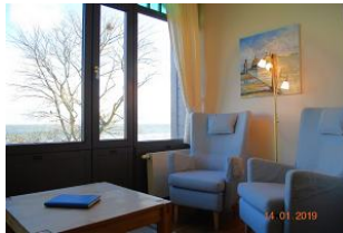
Blick in die Loggia.