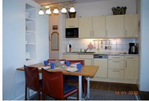
Blick auf den Essplatz und die Küchenzeile.