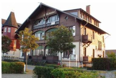
Blick vom Strand auf das Haus.

Ostseebad Heringsdorf OT Bansin, Strandpromenade 12