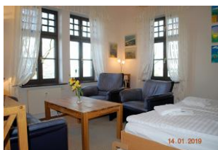
Blick in den Wohnraum mit Schrankbetanlage.