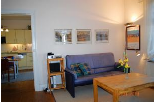
Blick vom Wohnraum zur Küchenzeile.