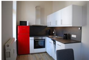
Blick in die neue Küche