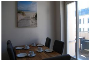
Blick auf den Essplatz in der Küche