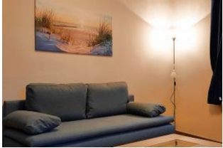
Blick auf das Schlafsofa im Wohnraum