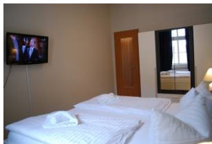
2. Blick in den Schlafraum