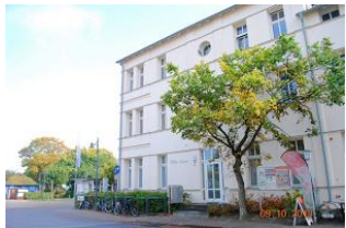
Seitlicher Blick auf das Haus und zur Promenade.

Die Villa Anna ist zentral in erster Reihe direkt an der Ahlbecker Strandpromenade gelegen und somit nur einen Katzensprung vom Strand und vom Ortszentrum entfernt. Das 57 m 2 große Appartement 05 befindet sich im 1. OG und verfügt über einen gemütlichen Wohnraum mit Schlafcouch, eine voll ausgestattete Küche mit Essplatz, einen Schlafraum mit Doppelbett, ein Vollbad mit Waschmaschine, kostenfreies WLAN und einen möblierten Balkon mit Ostseeblick. Haustiere sind auf Anfrage gestattet. PKW-Stellplatz ebenfalls auf Anfrage. Wir sind Partner von UsedomRad. Leihen Sie sich bei uns im Büro ein Fahrrad aus und erkunden Sie unabhängig und flexibel die traumhafte und vielfältige Sonnensinsel Usedom. Als Kurkarteninhaber können Sie zudem die Busse der Usedomer Bäderbahn (UBB) kostenfrei nutzen.