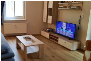
3. Blick in den Wohnraum