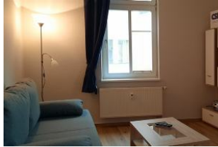
2. Blick in den Wohnraum