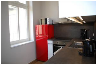
2. Blick in die neue Küche