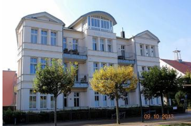
Blick von der Strandpromenade auf das Haus.

Ostseebad Heringsdorf OT Ahlbeck, Dünenstr. 36