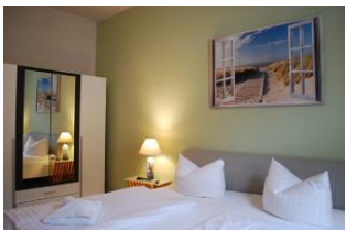
Blick in den neuen Schlafraum