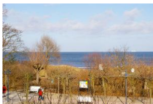
Seeblick aus der Veranda