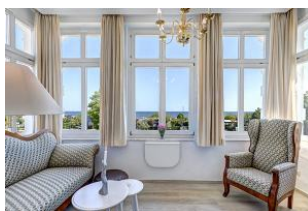
Blick in die Veranda