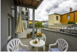
Eigene kleine Terrasse