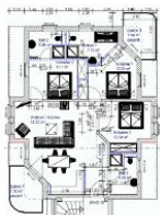
Wohnungsgrundriss (Möblierung exemplarisch)

STRANDNAH, GROSS, MODERN! Mit 2 BALKONEN (je ca. 8 qm), FAHRSTUHL, nur ca. 100 m zur STRANDPROMENADE! Großzügige elegante 4 - Zimmer - Wohnung mit sehr guter Ausstattung! 3 separate Schlafzimmer, 3 Bäder (2 davon ensuite), alle mit Fußbodenheizung. Die ensuite-Bäder verfügen über Wanne und Dusche bzw. Dusche. Das dritte Bad ist ein Duschbad. Der große Wohnbereich verfügt über eine vollausgestattete Küchenzeile, einen Eßbereich und einen Couchbereich mit KAMINOFEN. Die Balkone sind möbliert. Zur Wohnung gehört ein STRANDKORB AM STRAND. Die Wohnung verfügt über einen Pkw-Stellplatz in der teilüberdachten Tiefgarage. Fahrradabstellfläche ist vorhanden. Vom Haus aus können Sie das Ortszentrum und die bekannte Ahlbecker Seebücke in ca. 2 Minuten zu Fuß erreichen.