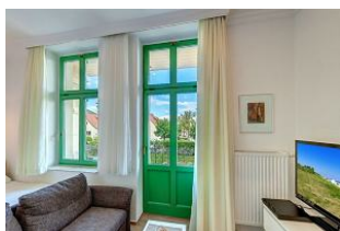
Küchenzeile und Eßplatz