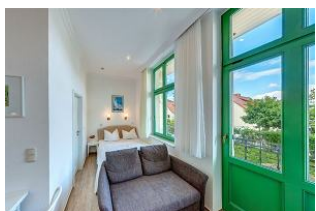
Kombinierter Wohn- / Schlafraum

STRANDNAH! Nur ca. 100 m zur Strandpromenade mit BALKON! Gemütliches 1-Zimmer-Apartment mit guter Ausstattung. Wohn-/Schlafraum mit Doppelbett und Sitz-/Sofaecke, Küchenzeile mit Essplatz, kleines Duschbad mit großer walk-in-Dusche, Balkon. Die Wohnung verfügt über einen Pkw-Stellplatz. Abstellraum für Fahrräder und ähnliches ist vorhanden. Eine Sauna in der "Villa Germania" kann kostenpflichtig genutzt werden. Vom Haus aus können Sie das Ortszentrum und die bekannte Ahlbecker Seebrücke in ca. 3 bzw. 5 Minuten zu Fuß erreichen.