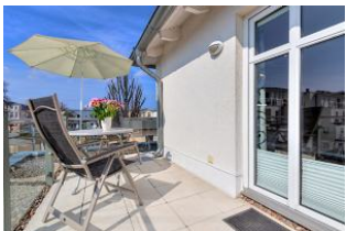
Dachterrasse nach Süden mit Essplatz