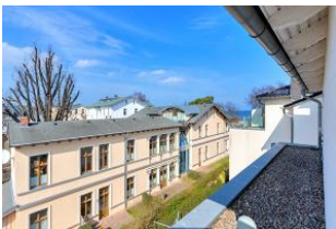
Dachterrasse (Blick seitlich)