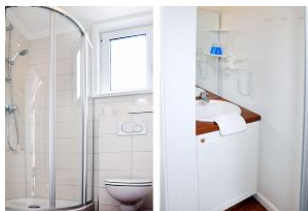
... und noch einen Blick ins Badezimmer.