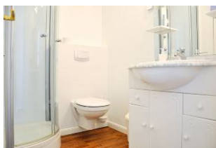
. . . und noch einen Blick ins Badezimmer