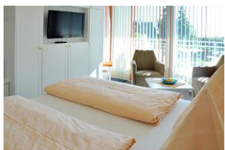
Helles wohnen . . .

Schönes und komfortables Doppelzimmer mit Süd - Balkon und Meerblick. Genießen Sie den einmaligen Blick nach Süden auf die Nordsee und die Halligen. Bitte beachten Sie unsere Sonder - Arrangements.