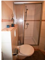
Das helle Duschbad...