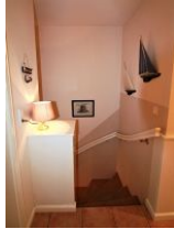
Der Treppenabgang in das Untergeschoss.