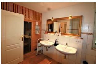
... und bietet eine kleine Sauna.