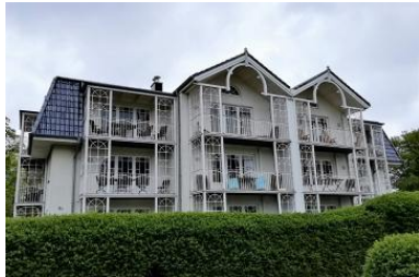
Das wunderschöne Haus von außen

Die Unterkunft verteilt sich über EG und UG.