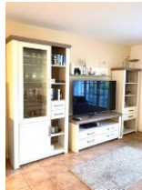
Ein großer Fernseher für spannende Krimis am Abend.