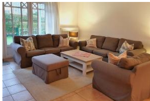
Lichtdurchflutet und gemütlich - auf der Sofalandschaft können Sie die Füße hochlegen und relaxen.