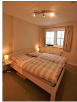
Das zweite Schlafzimmer mit gemütlichem Doppelbett im UG.