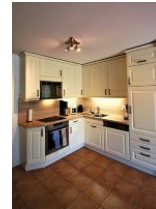
Die offene Küchenzeile ist voll ausgestattet.