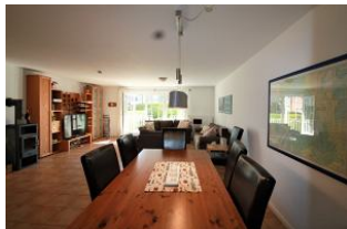
Das weitläufige Wohnzimmer mit großem Essbereich.

Ihre Unterkunft befindet sich im EG und UG dieses wunderschönen Hauses in Bäderarchitektur. Herzlich Willkommen im Palais am Südstrand, Ihrer komfortablen und modern eingerichteten Ferienwohnung. Ihre liebevoll ausgestattete Ferienwohnung bietet Platz für bis zu 6 Personen und verteilt sich auf zwei Ebenen. Im unteren großzügigen Badezimmer befindet sich Ihre eigene Sauna. Der beliebte Südstrand und die Nordsee erreichen Sie in wenigen Schritten. Die ruhig gelegene Wohnung bietet einen eigenen kleinen eingezäunten Garten, so dass auch Ihr Hund bei uns herzlich Willkommen ist.