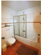
Das größere Duschbad befindet sich im UG ....