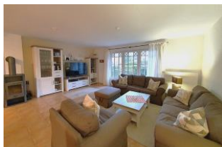
Viel Platz für die ganze Familie