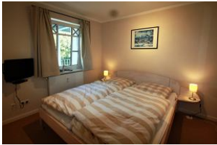
Das erste Schlafzimmer befindet sich im Erdgeschoss.