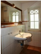
... im EG.