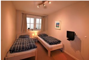
Das dritte Schlafzimmer befindet sich im UG und ist mit zwei Einzelbetten ausgestattet.