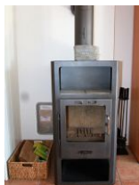
Ein kleiner Kaminofen bringt bei Schietwetter wohlige Wärme