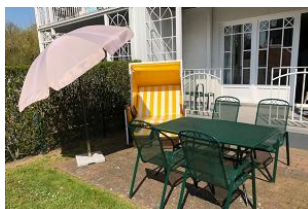
Der Garten ist eingezäunt.