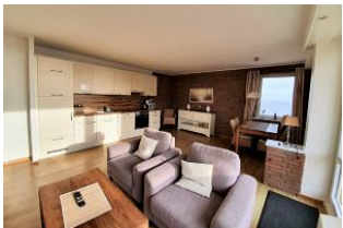
Das lichtdurchflutete Wohnzimmer mit offener Küche.

Diese traumhafte Ferienwohnung mit großartigem Meerblick befindet sich im 4. OG und ist für max. vier Personen ausgelegt. Die ca. 70 qm große Wohnung ist mit einem Fahrstuhl ganz bequem zu erreichen. Sie verfügt über zwei Schlafzimmer und einen sehr gemütlichen Wohn - Ess- Bereich mit offener und vollausgestatteter Küche. Auf dem Balkon wartet ein schöner Strandkorb auf Sie. Die Promenade und die Innenstadt sind nur einen Katzensprung entfernt. Sie wohnen ruhig und sehr zentral. So macht der Urlaub Spaß.