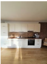
Die Küche ist gut ausgestattet.