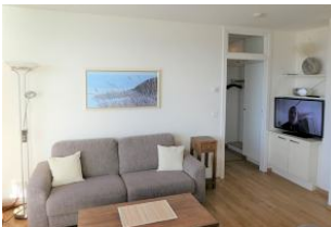
Die gemütliche Couch