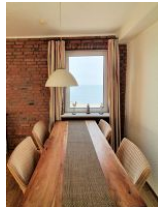
Der Essbereich lädt zu schönen gemeinsamen Stunden ein.