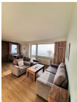
Das geräumige Wohnzimmer mit Meerblick.