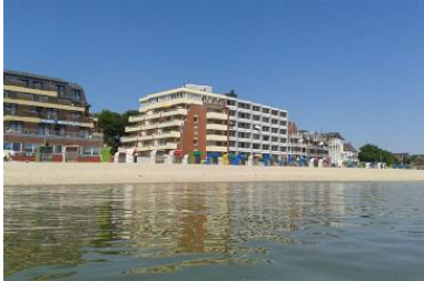
Das Haus von außen