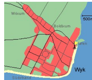
Entfernungen, zirka: zum Bäcker 25 m, zur Einkaufsmöglichkeit 25 m, zum Flugplatz 3,0 km, zum Golfplatz 3,0 km, zum Hafen 50 m, zum Meer 2 m, zum Badestrand 2 m, zum Ortszentrum 0 m