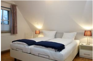
Im OG das Elternschlafzimmer