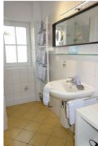
Das Bad mit...