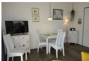
Esstisch und TV Gerät.