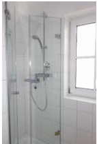
...Dusche, neu mit Glastür.