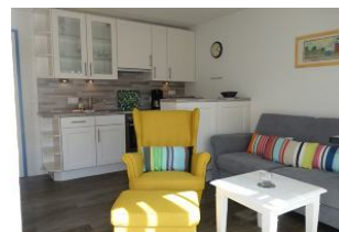
...wer mag sich hier nicht niederlassen ?