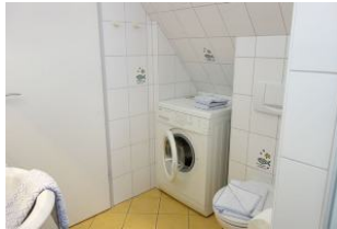
... und Waschmaschine