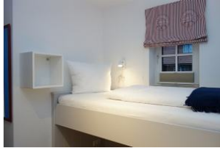
Das obere Bett