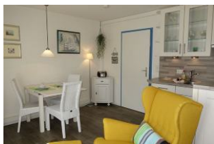
Sessel, Küche, im Hintergrund der Esstisch.