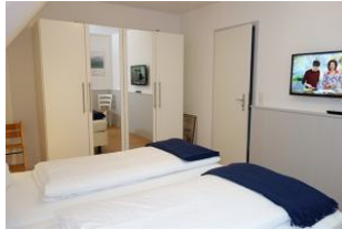
Großer Schrank für düt un dat....