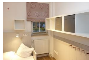
...offenes Regal und Haken für die Kofferinhalte