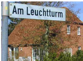
Das Haus Am Leuchtturm 1a

Die Unterkunft verteilt sich über EG und 1.OG.