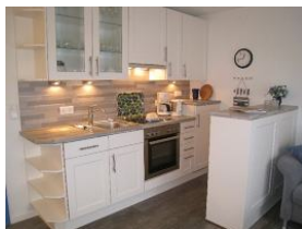
Die Küche mit Backofen.