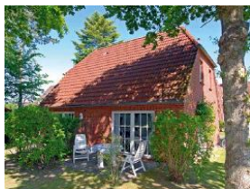
Die Terrasse, schön eingewachsen !