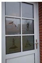
...Herzlich Willkommen !

Unsere kleine Haushälfte am Wyker Südstrand steht nur wenige Schritte vom Leuchtturm entfernt. Sie können das Meer zwar nicht sehen, aber hören und vielleicht auch riechen. Für 2 Personen ideal, aber auch 4 Personen finden hier Platz für einen erholsamen Familienurlaub. Wohnzimmer und Küche - total gemütlich. Festnetz Flat und WLAN Verbindung sowie die Nutzung der Waschmaschine sind kostenfrei.