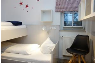
Ein Stuhl zum "am Bett sitzen und vorlesen" ....