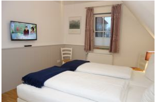
Das zweite TV Gerät im Schlafzimmer