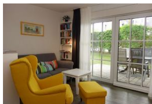
Der gemütliche Sessel mit Blick " ins Grüne....."