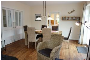
Der Blick von der Sitzecke zum Esstisch