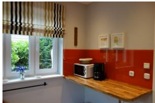
...und eine sep. Arbeitsfläche