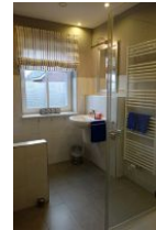
Das Duschbad im EG, hier befindet sich auch die Waschmaschine, die Ihnen kostenfrei zur Verfügung steht.