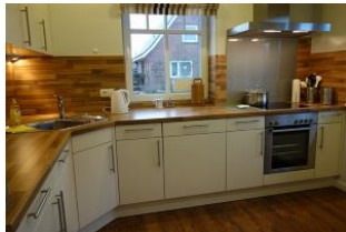
Die sep. Küche hat alles "was man so braucht"