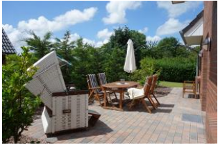
Die herrlich eingewachsene Terrasse. Die Terrassentür befindet sich am Essplatz.