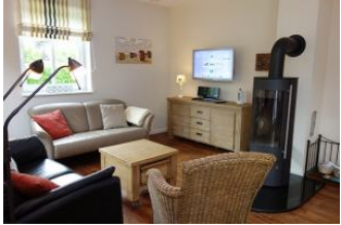
Zwei Sofas, ein Sessel - herrliche Runde für den perfekten TV - Abend