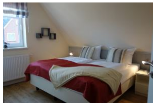
Ein weiteres Schlafzimmer im OG mit zwei Einzelbetten und