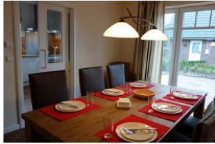
Der große Esstisch - im Hintergrund, die Küche. Rechts die Terrassentür