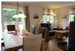
Der Blick vom Esstisch zur Sitzecke