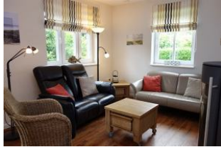
Der schwarze Zweisitzer ist besonders gemütlich, die Rückenlehnen sind verstellbar ....