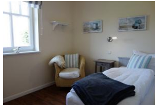
Ein Schlafzimmer im Erdgeschoß mit Einzelbett, Kleiderschrank. Nicht im Bild, das TV - Gerät.