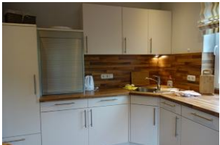
Ein Teil der Küchenzeile...