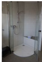
....großer Duschkabine und einer Sitzbank für Kinder