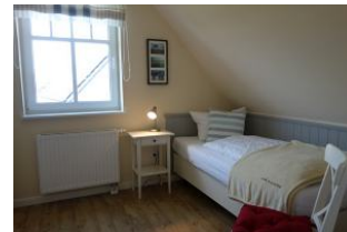
Ein Schlafzimmer im OG mit Einzelbett, auch hier großer Kleiderschrank und TV - Gerät. (nicht im Bild)