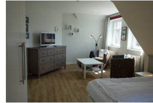
... herrlich groß, mit gemütlichen Sesseln für die Lesestunde, oder einen Film anzusehen.