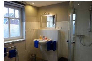
Das Duschbad im Obergeschoß mit ....