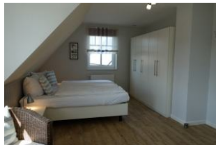
Viel Schrankraum .....