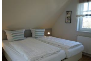
Zwei Einzelbetten - zusammen gestellt - im Elternschlafzimmer im OG...