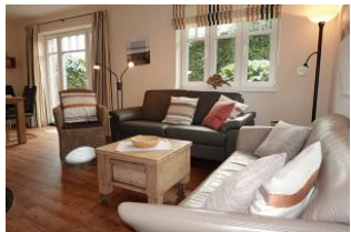
Zwei Sofas garantieren einen gemütlichen Abend

Dieses Einzelhaus in der Flurstrasse in Wyk, läßt Urlaubsherzen höher schlagen. Herrlich für Familien. Vier Schlafzimmer geben jedem Familienmitglied eine Rückzugsmöglichkeit. Der gemeinsame Wohn- Essraum mit halb offener Küche dient der Kommunikation. Zwei Bäder lassen auch am Morgen nicht das Frühstück in unendliche Ferne rücken. Das Fensteröffnen zum lüften ist nicht nötig, das Haus verfügt über eine zentrale Lüftungsanlage, die einen hohen Komfort der Raumluft garantiert. Hier wurde an Alles gedacht, seien Sie gespannt. Ach übrigens, sind Sie vielleicht Schachspieler ? Im Garten befindet sich ein 4x4 m großes Schachfeld aus Steinplatten, den Schlüssel zum Schrank für die großen Figuren bekommen Sie bei uns !