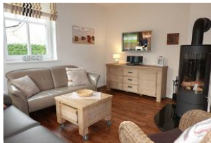
Das TV Gerät und Ofen