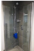
.... mit Duschkabine, Echtglastüren und Bodenablauf.