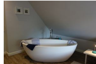
...und frei stehender Badewanne. Nach dem Bad: