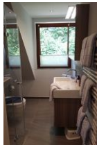
Das Bad mit Handwaschbecken und Toilette....