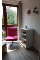
Schmökerstunde am Fenster.....