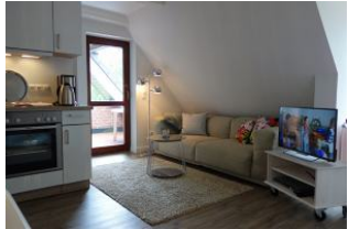
Die große Couch zum "langmachen"...