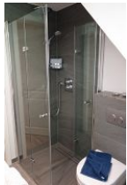
....und Duschkabine, aus Echtglas, sehr bequem: die Glaswand ist komplett weg zu klappen.