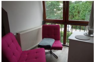
...sie stehen im Erker zum schmökern mit Blick ins Grüne !