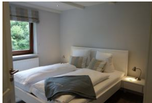
Ein Schlafzimmer mit großem Doppelbett (180x200cm, ohne Fussteil)....