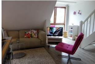
....schnell ist ein Sessel herbei gezogen,...