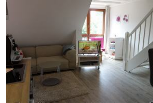
Das Wohnzimmer, die Treppe führt in das Schlafzimmer im Dachgeschoß