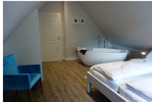
..mit gemütlichem Sessel....