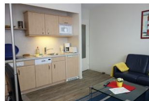
Hier noch einmal die Küchenzeile