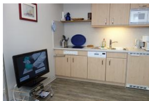
Die offene Küchenzeile