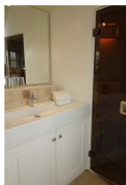
Das Waschbecken im Bad im OG, Eingang zur kleinen Sauna