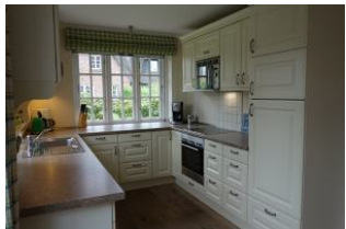
Die Küche von der einen...