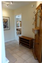
Der Flur im Eingangsbereich