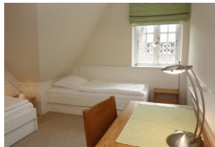
Das Kinderzimmer mit zwei Einzelbetten.