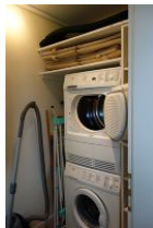
Waschmaschine und Trockner, Bügelbrett und Bügeleisen.