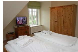
...mit TV Gerät