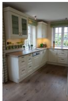
.... und der anderen Seite.