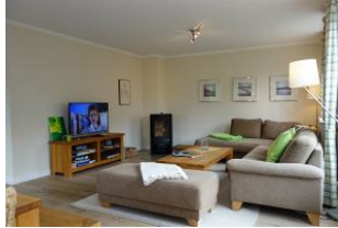
...einem gemütlichen Abend steht nichts mehr im Weg.