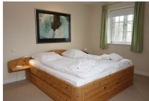
Das Doppelschlafzimmer im OG...