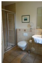
Das Bad im EG