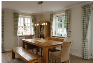
Hier noch einmal der Essplatz, hell und freundlich