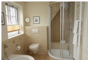
Die Dusche und Toilette im Bad im OG