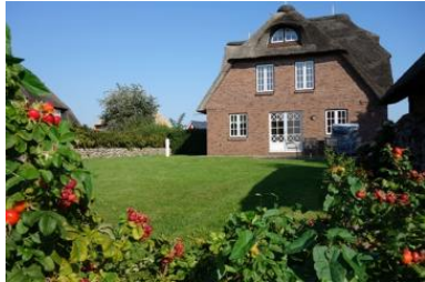
Das Haus "Am Dunsumer Deich" mit großem Garten

Die Unterkunft verteilt sich über EG, 1.OG und 2.OG.