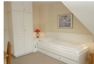
.... unter diesem befindet sich noch ein Ausziehbett.