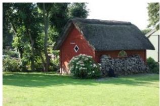
Im Schuppen dürfen Sie gern Ihre Räder unter stellen.