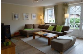
Genügend Platz für Alle ....