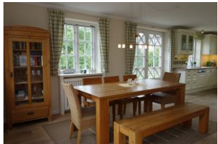
Der Essplatz, im Hintergrund die Küche