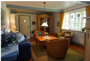
Das gemütliche Wohnzimmer