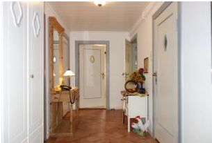
...treten Sie ein...