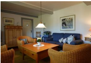
Eine Couch, drei Sessel - gemütlicher gehts kaum