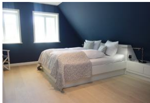
Das Elternschlafzimmer mit Doppelbett 180x200 cm ohne Fussteil