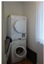
Im Hauswirtschaftsraum zur kostenfreien Nutzung; Waschmaschine und Trockner.