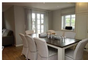
Dieser Esstisch bietet allen Familienmitgliedern einen Platz.