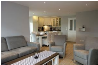
Die Sitzecke mit Blick zur Küche