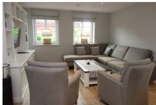
Die Sitzecke...für jeden ein gemütliches Plätzchen