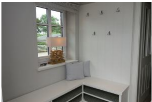
Der Eingangsbereich, Platz für Outdoorkleidung und Schuhe

Im idyllischen Ort Oevenum finden Sie das Doppelhaus Golfoase. Zwei großzügige Doppelhaushälften für je 6 Personen erwarten Sie. Ein gemütliches Wohnzimmer mit offener Küche und familientauglichem Essplatz, Austritt in den Garten und zur möblierten Terrasse, Sauna (mit Zusatzkostenverbunden). Ein großes Badezimmer mit Waschmaschine und Trockner. Im Obergeschoß die Schlafräume und ein weiteres Dusch+Wannenbad. Hier ist an alles gedacht, hier kann man sich wohlfühlen, hier... wird es Ihnen einfach nur gut gehen und das Beste.....Ihr Vierbeiner darf auch dabei sein.