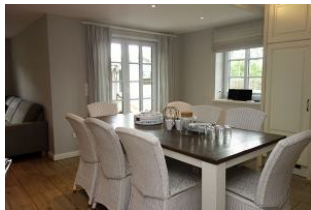
Dieser Esstisch bietet allen Familienmitgliedern einen Platz.