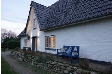
Die Aussenansicht des Hauses Friesengeist in Wrixum, Ohl Dörp 25

Die Unterkunft verteilt sich über EG und 1.OG.