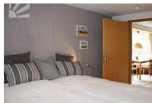
Schlafzimmer mit Einbauschränk