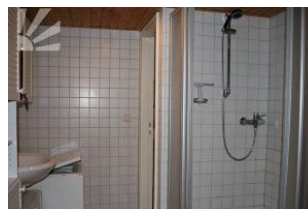
grosses Bsd mit Dusche, WC, Waschmaschine