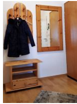
Blick in die Eingangsdielen