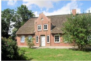
Wunderschönes Friesenhaus mit 2 Ferienwohnungen

Die Immobilie verteilt sich über EG und 1.OG.