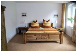
Blick in eines der zwei Schlafräume