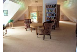
Das zweite Schlafzimmer mit kleiner Sitzgruppe und Schreibtisch