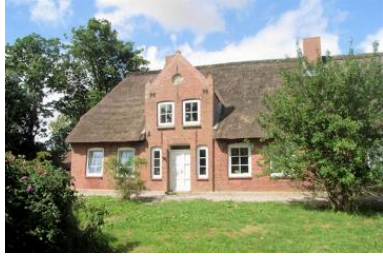
Wunderschönes Friesenhaus mit 2 Ferienwohnungen

Die Immobilie verteilt sich über EG und 1.OG.