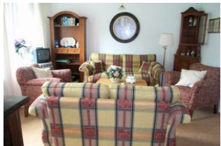
Geschmackvoll eingerichtetes Wohnzimmer