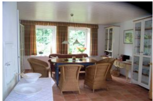
Große Wohnküche mit gemütlicher Sitzecke und Zugang zum Garten

Nahe Dagebüll, im Kleiseer-Koog, liegt dieses wunderschöne reetgedeckte Friesenhaus. Es wurde 1875 erbaut, 1979 umgebaut und im Jahr 2000 komplett neu renoviert. Das Haus verfügt über 2 Wohnungen (91,13 m 2 und 168,81 m 2 ), die mit einer Gaszentralheizung beheizt werden. Das Grundstück hat eine Größe von 2862 m 2 .