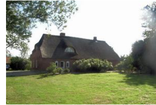
Rückseite des Hauses mit großen Garten.