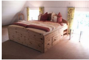
Das zweite große Schlafzimmer befindet sich im 1. Stock