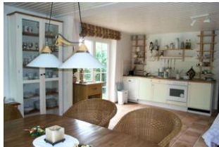
Die Küche aus einer anderen Perspektive