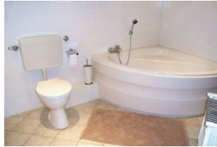
Badezimmer mit Eckwanne