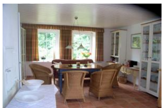
Große Wohnküche mit gemütlicher Sitzecke und Zugang zum Garten

Nahe Dagebüll, im Kleiseer-Koog, liegt dieses wunderschöne reetgedeckte Friesenhaus. Es wurde 1875 erbaut, 1979 umgebaut und im Jahr 2000 komplett neu renoviert. Das Haus verfügt über 2 Wohnungen (91,13 m 2 und 168,81 m 2 ), die mit einer Gaszentralheizung beheizt werden. Das Grundstück hat eine Größe von 2862 m 2 .