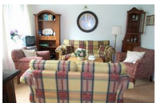
Geschmackvoll eingerichtetes Wohnzimmer