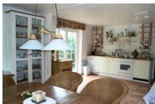
Die Küche aus einer anderen Perspektive