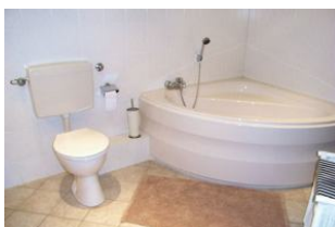
Badezimmer mit Eckwanne