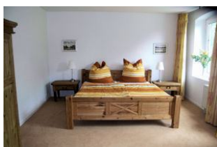
Blick in eines der zwei Schlafräume