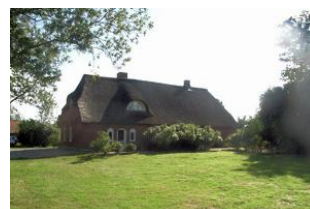
Rückseite des Hauses mit großen Garten.