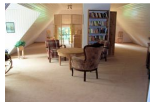
Das zweite Schlafzimmer mit kleiner Sitzgruppe und Schreibtisch