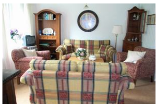
Geschmackvoll eingerichtetes Wohnzimmer