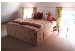
Das zweite große Schlafzimmer befindet sich im 1. Stock