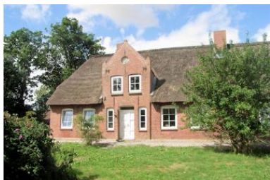
Wunderschönes Friesenhaus mit 2 Ferienwohnungen

Die Immobilie verteilt sich über EG und 1.OG.