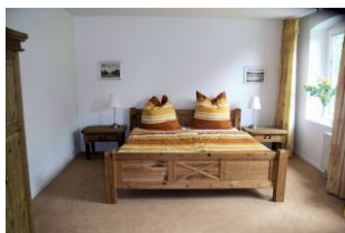
Blick in eines der zwei Schlafräume