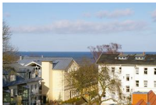
Seeblick vom Balkon