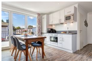
Küche und Essplatz