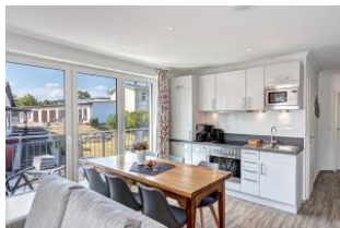
Küche und Essplatz