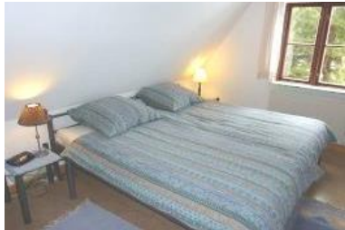
Das gemütliche Elternschlafzimmer mit großem Doppelbett (200 x 200 cm)