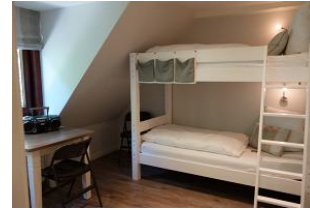
Ein Schlafzimmer mit Etagenbett.