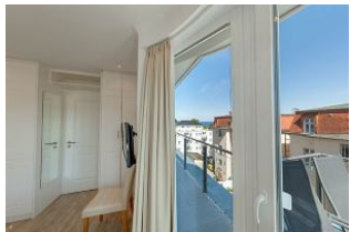
Blick aus Schlafzimmer