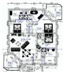
Wohnungsgrundriss (Möblierung exemplarisch)

STRANDNAH, GROSS, MODERN! Mit 2 BALKONEN (je ca. 11 qm), FAHRSTUHL, SAUNA und nur ca. 100 m zur STRANDPROMENADE! Großzügige elegante 4 - Zimmer - Wohnung mit sehr guter Ausstattung! 3 separate Schlafzimmer, 3 Bäder (2 davon ensuite), alle mit Fußbodenheizung. Die ensuite-Bäder verfügen über Wanne und Dusche bzw. Dusche. Das dritte Bad ist ein Saunabad mit Saunakabine und Schwalldusche. Der große Wohnbereich verfügt über eine vollausgestattete Küchenzeile, einen Eßbereich und einen Couchbereich mit KAMINOFEN. Die Balkone sind möbliert. Zur Wohnung gehört ein STRANDKORB AM STRAND. Die Wohnung verfügt über einen Pkw-Stellplatz in der teilüberdachten Tiefgarage. Fahrradabstellfläche ist vorhanden. Vom Haus aus können Sie das Ortszentrum und die bekannte Ahlbecker Seebücke in ca. 2 Minuten zu Fuß erreichen.