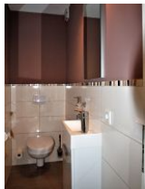
Das kleine und separate Gäste-WC