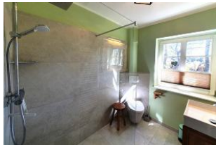
Das großzügige Tageslichtbad mit begehrter Regendusche.