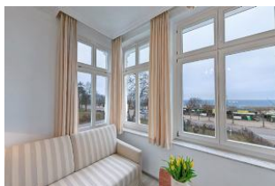
Blick aus Veranda