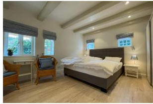
Schlafzimmer mit Boxspringbett