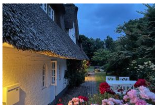
Abendstimmung in Borgsum