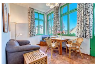
Wohnen und Essen

STRANDNAH! Nur ca. 100 m zur Strandpromenade mit TERRASSE, KLEINEM GARTEN und STRANDKORB! Gemütliches 2-Zimmer-Apartment mit freundlicher Ausstattung. Separates Schlafzimmer, Wohnzimmer mit Schlafcouch, Küchenzeile, Essplatz, geräumiges Duschbad, Terrasse mit Gartenmöbeln und STRANDKORB (Frühling bis Herbst) und kleinem Gartenstück, separater Eingang. Die Wohnung verfügt über einen Pkw-Stellplatz . Abstellraum für Fahrräder und ähnliches ist vorhanden. Eine Sauna in der "Villa Germania" kann kostenpflichtig genutzt werden. Vom Haus aus können Sie das Ortszentrum und die bekannte Ahlbecker Seebrücke in ca. 3 bzw. 5 Minuten zu Fuß erreichen.