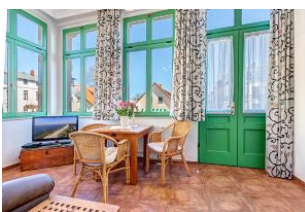
Wohnen und Essen