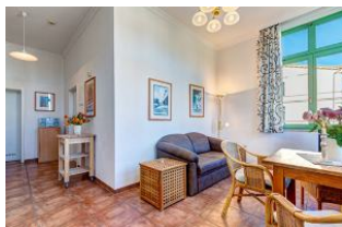
Wohnen und Essen