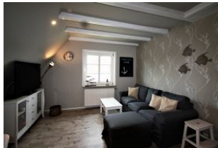
Modern & stilvoll, hier können sich unsere Gäste im Wohnzimmer heimisch fühlen und es sich gemütlich machen.