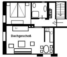
Der Grundriss der Wohnung.