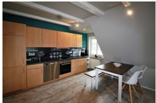
Die vollausgestattete Küche

Das Haus Nis Puk ist nur ca. 800m vom Dorfkern Utersum entfernt, so dass Sie fußläufig alles erreichen können, was Sie für den täglichen Bedarf benötigen. Der Strand ist nur wenige Gehminuten entfernt, hier kann man die phänomenalsten Sonnenuntergänge der gesamten Insel erleben. Die im Obergeschoss befindliche Wohnung ist mit ihren 60 qm 2 , dem eigenen Parkplatz und den zwei gemütlichen Schlafräumen, dem Wohnraum mit WLAN-Zugang, einer vollausgestatteten Kochnische und dem Duschbad ideal für 4/5 Personen geeignet und lädt mit der stilvollen Einrichtung, die liebevoll ausgewählt wurde, sowie einer Sitzecke im Garten zum Wohlfühlen & Relaxen ein.