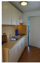
Die offene Küchenzeile, die Tür führt ins Schlafzimmer