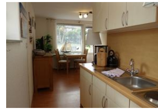
Die Küchenzeile vom Schlafzimmer aus Richtung Wohnzimmer.