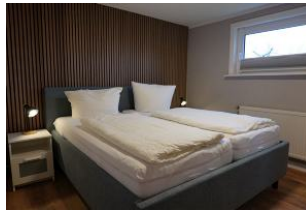
Das Schlafzimmer mit großem Doppelbett...