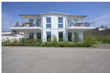
Hausansicht Neubau Villa Margarete