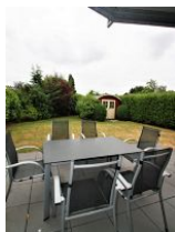
Die schöne Terrasse mit dem eigenen kleinen Garten